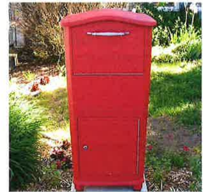
Boîte aux lettres sécurisée

En tout temps, vous pouvez y déposer vos chèques postdatés ou autres documents!