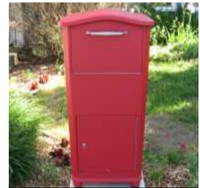
Boîte aux lettres sécurisée

En tout temps, vous pouvez y déposer vos chèques postdatés ou autres documents !